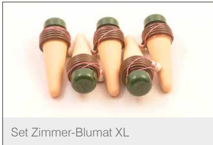
Set Zimmer-Blumat XL

Mit der praktischen und schnell einsatzbereiten Bewässerung können Sie Ihre Pflanzen dauerhaft und sicher bewässern.