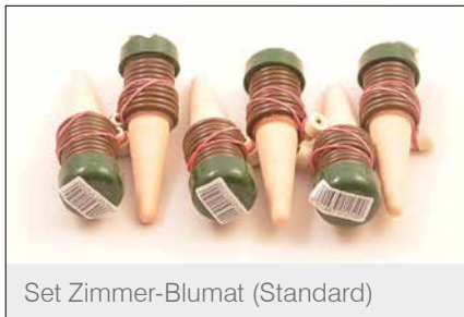
Set Zimmer-Blumat (Standard)